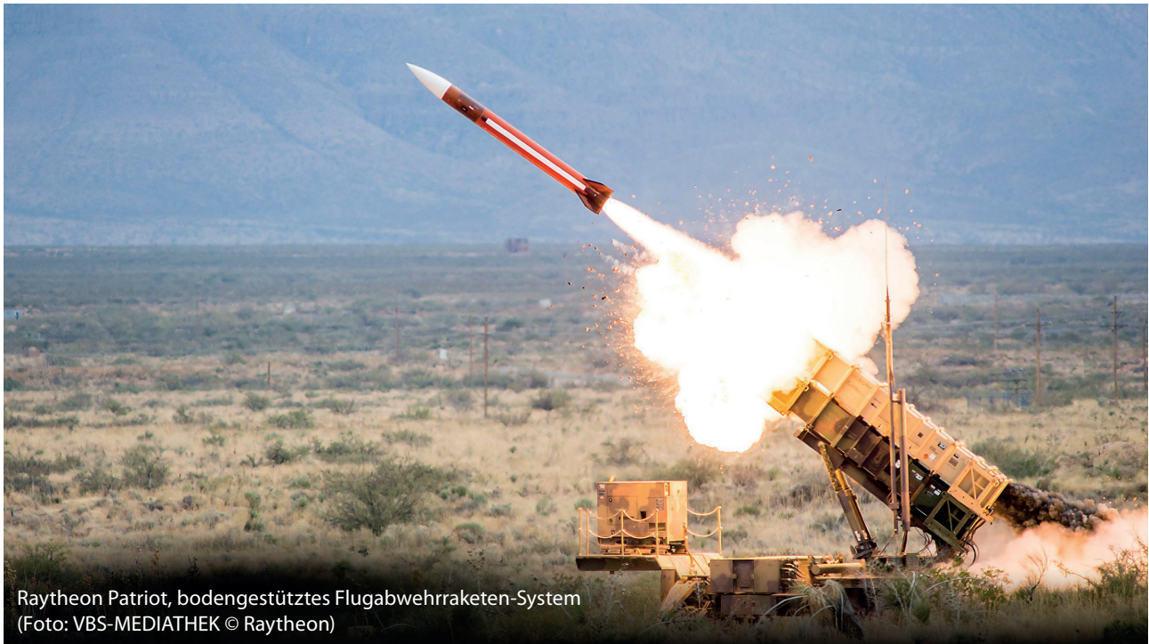
Raytheon Patriot, bodengestütztes Flugabwehrraketen-System